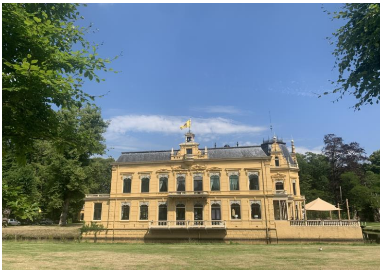
National Borg & Rijtuigmuseum in Nienoord (AC Leek)

Die Gesellschaft für bildende Kunst und vaterländische Altertümer seit 1820 (1820dieKUNST) ist einer der ältesten Kunst- und Kulturvereine Deutschlands. Sie ist Begründerin und Trägerin des Ostfriesischen Landesmuseums Emden – seit 1962 gemeinsam mit der Stadt Emden im Rathaus am Delft.