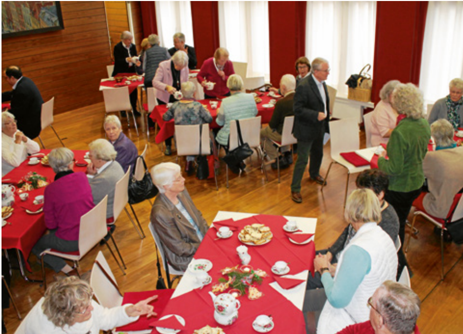
Abb. 1: Die Weihnachtsfeier für die Ehrenamtlichen am 12.12.2016 im „Rummel“