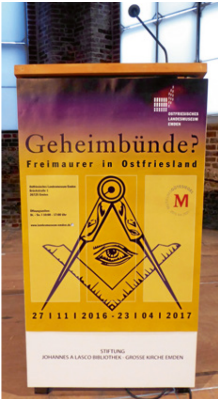
Abb. 9: Eröffnung Sonderausstellung „Geheimbünde? Freimaurer in Ostfriesland“ in der Johannes a Lasco Bibliothek

Das Stück spiegelte das Leben im 17. Jahrhundert wider und zeigte Unterschiede, aber auch Ähnlichkeiten zur heutigen Zeit. Historie und Fiktion verschmolzen zu einem Theater-Abenteuer auf der Naturbühne an der Vrouw Johanna-Mühle. Mithilfe des Regisseurs Werner Zwarte und Darstellern aus der gesamten Region und den Krummhörner Spielleuten der Ländlichen Akademie Krummhörn wurde ein Stück Vergangenheit greifbar nah.