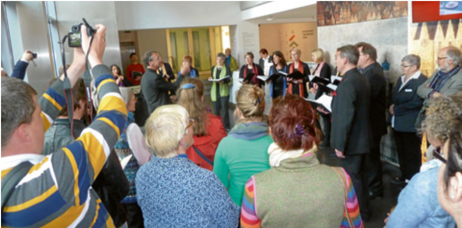
Abb. 16: Wandelkonzert im Ostfriesischen Landesmuseum Emden am 15. Mai 2016

einbringt. Das Kulturnetzwerk Ostfriesland war Ausrichter der kulturtouristischen Themenjahre „Garten Eden 2007“, „Abenteuer Wirklichkeit 2010“, „Land der Entdeckungen 2013“ sowie „Land der Entdeckungen 2016“. Das Netzwerk wird maßgeblich betreut durch die Kulturagentur der Ostfriesischen Landschaft und die Ostfriesland Tourismus GmbH. Mitglieder sind neben dem Museum Partner wie die Kunsthalle Emden, das Schlossmuseum Jever oder das Organeum in Weener sowie weitere wichtige Kultureinrichtungen der Urlaubs- und Kulturdestination Ostfriesland.