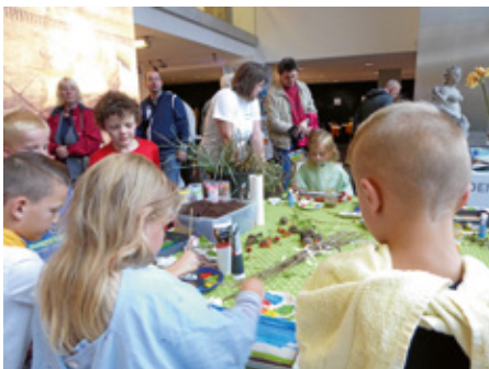
Abb. 15: Museumspädagogisches Angebot zur Emdener Museumsnacht am 13.08.2016