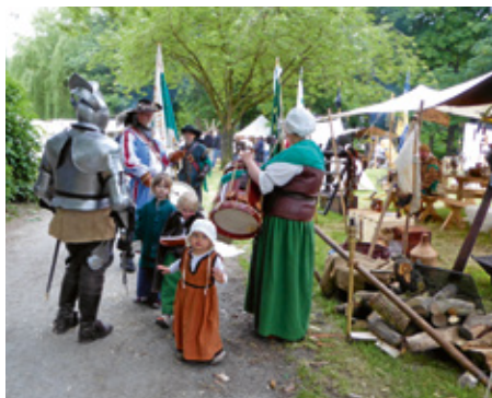
Abb. 7: Heerlager anlässlich des Jubiläums „400 Jahre Emdener Wall“