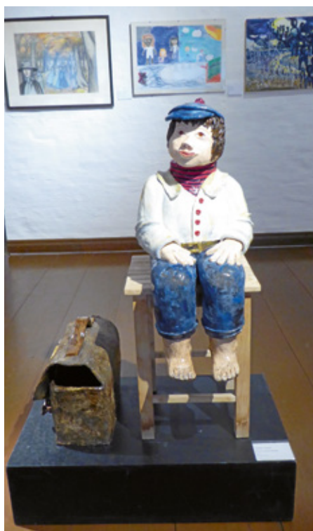
Abb. 10: 36. Emder Kunstaussstellung. Johanne Lammers, Warten auf den Schulbus, 2015, Keramik, Acryl

11.12.-05.02.2017: 37. Emder Kunstaussstellung (sog. „Weihnachtsausstellung“)