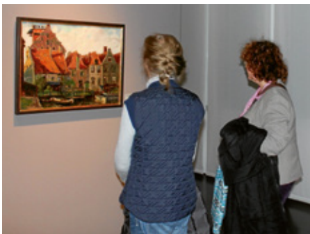
Abb. 5: Eröffnung Szenenwechsel, Neue Galerie am 23.03.2016