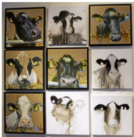
Abb. 11: Sonderausstellung „Schwarzbunt“. Ulrich Schnelle und Ludger Brauckhoff