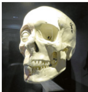
Abb. 6: Sonderausstellung „1636 – Ihre letzte Schlacht“

Vom 10. bis 12. Juni luden das Ostfriesische Landesmuseum Emden und etwa 200 Darsteller im Rahmen dieser Sonderausstellung gemeinsam zu einer Zeitreise auf die Wallanlagen ein. Frühneuzeitliches Leben und Handwerk sowie spektakuläre Waffendarbietungen begeisterten ca. 12.000 Besucher und waren Teil eines Ereignisses, das es so noch nie in Ostfriesland gegeben hat.