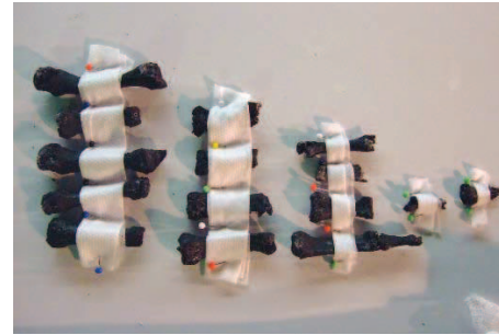
Die Zehen der Emdener Moorleiche. Heute geht man äußerst behutsam mit den frühmittelalterlichen Überresten um – sie werden sprichwörtlich in Watte gepackt.

Auch die Kleidung der Moorleiche ist indessen gründlich untersucht worden – ebenso jene Frag-